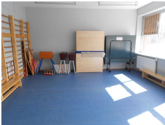
SALĂ MODERNĂ DE SPORT DOTATĂ PENTRU PRACTICAREA OPTIMĂ A EDUCAȚIEI FIZICE