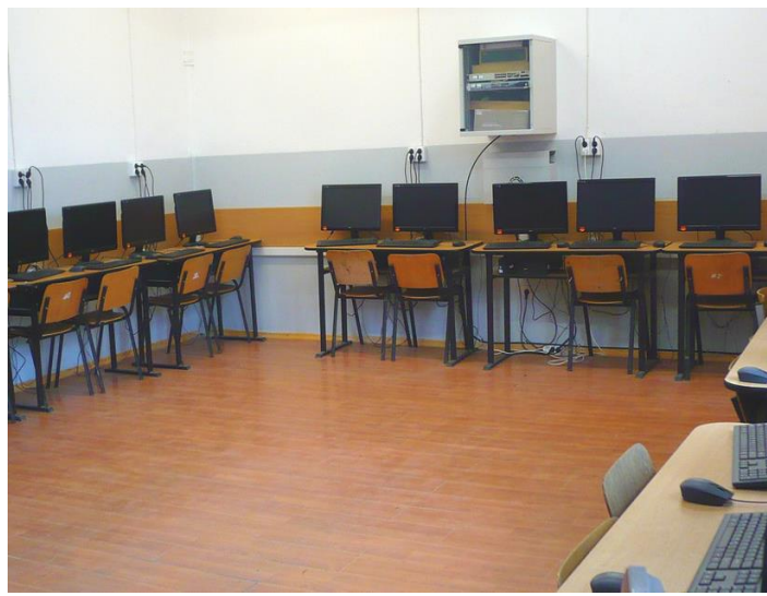
CABINET DE INFORMATICĂ