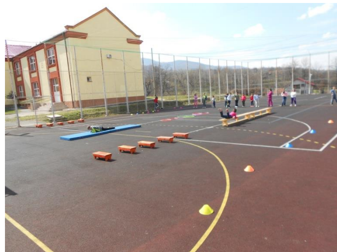
TEREN DE SPORT ÎMPREJMUIT CU GARD ȘI ACOPERIT CU TARTAN

„Nu zidurile fac o școală, ci spiritul ce domnește într-însa.”