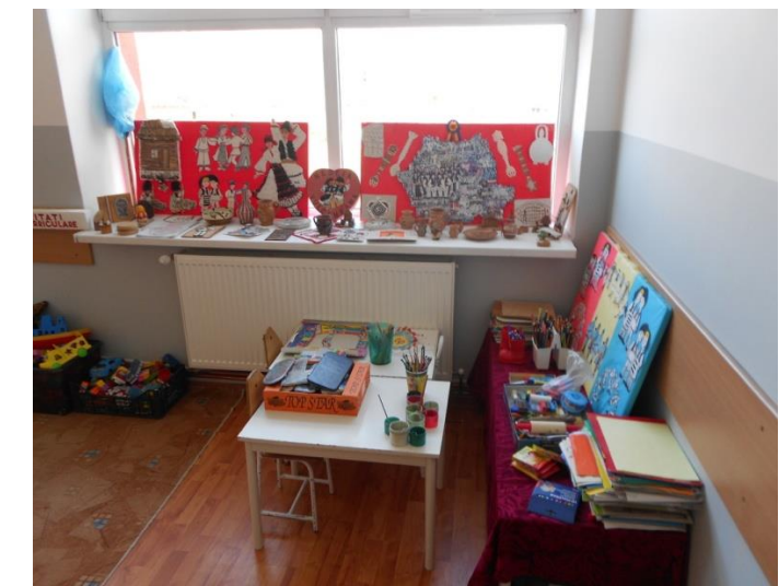
ÎNVĂȚAREA LIMBII ENGLEZE ÎNCĂ DIN CLASA PREGĂTITOARE