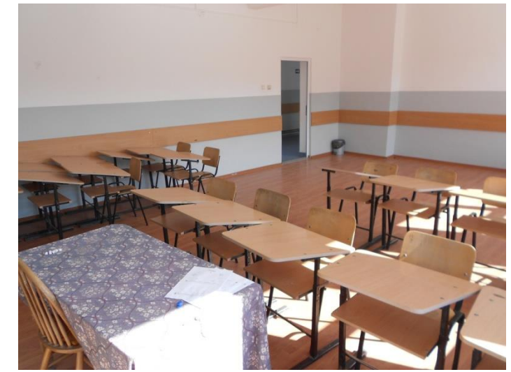
CLASE DOTATE CU MOBILIER ADECVAT ȘI TABLE ECOLOGICE